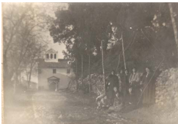
SANTUARIO DE LA FUENSANTA HUELMA, SIGLO XIX