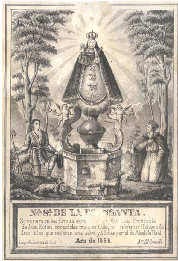
Litografía de 1866 de autor desconocido

invitándolos a su “ piadoso ejercicio... por el que se implora la Gracia de Dios por intercesión de nuestra Patrona y Señora María Santísima de la Fuen-Santa ”.