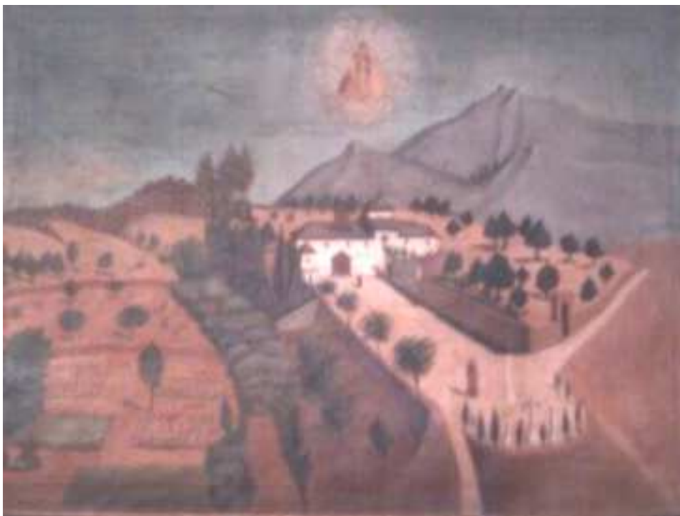
Óleo del Santuario de primeros del siglo pasado