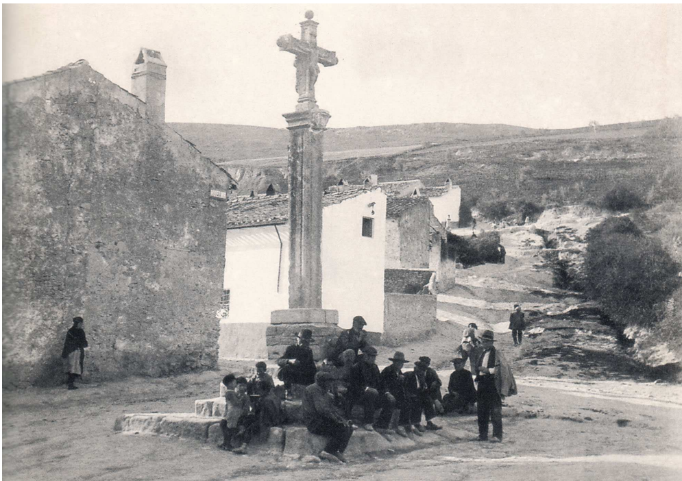
Cruz del Barrio.

De esta cruz se conserva una foto que ha sido portada en numerosas publicaciones locales.