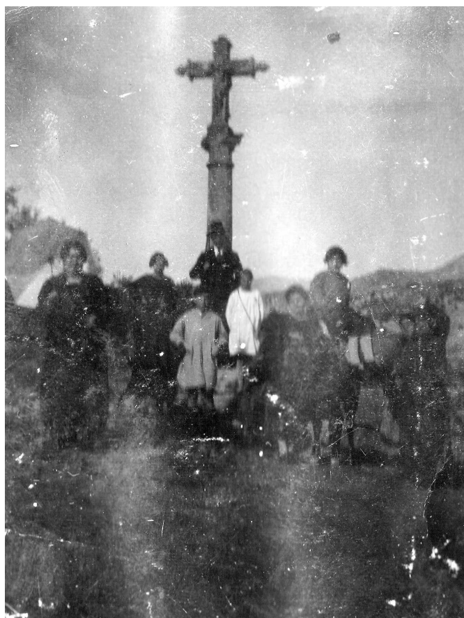
Cruz del Soto. Fotografía dejada por Paco Amaro.

semejanza a la cruz pintada por el Sr. Amaro, además de estar ubicada en medio del campo. Las personas que posan a su pie es familia del farmacéutico.