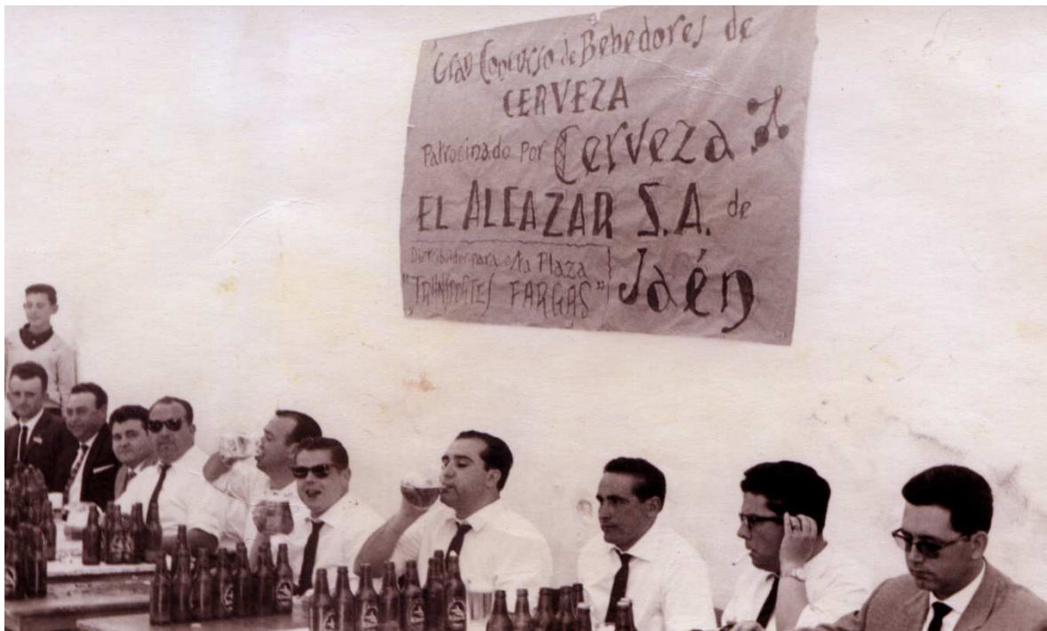
Concurso de bebedores de cerveza 2

¡Y qué decir del concurso de bebedores de cerveza! Si hoy se volviera a realizar seríamos escaparate de toda España.