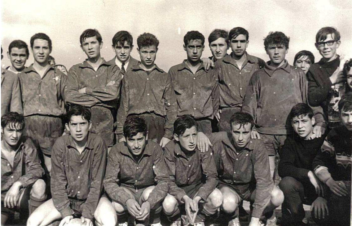
Equipo de los años 66/67 3

En 1968 se invita a la Unión Deportiva Maracena, Jaén Deportivo y C.F. Torredonjimeno. En 1969 se invitan al Real Jaén y al Iliturgi de Andújar, equipos que juegan en la 3ª División, y al Torredonjimeno, muy probablemente como ganador de año anterior.