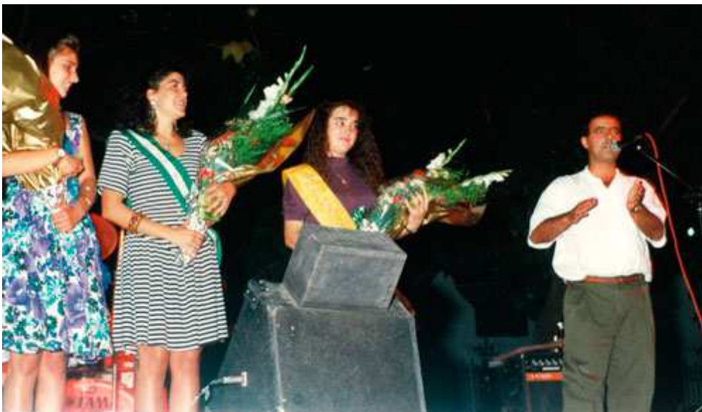
Miss Huelma 1990 con sus damas el día de la elección.

El certamen Serranilla de Mágina se celebró en la caseta municipal de la Calesera el sábado 25 de agosto a las 12 de la noche.