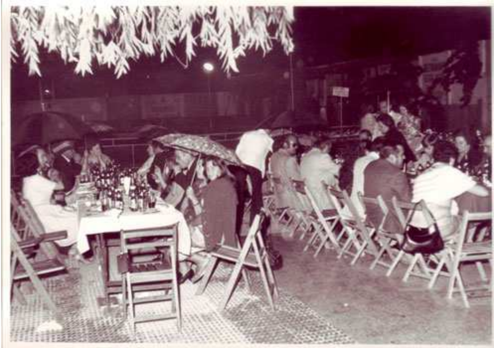
Cena de la Serranilla de 1971 mientras caía una tormenta.