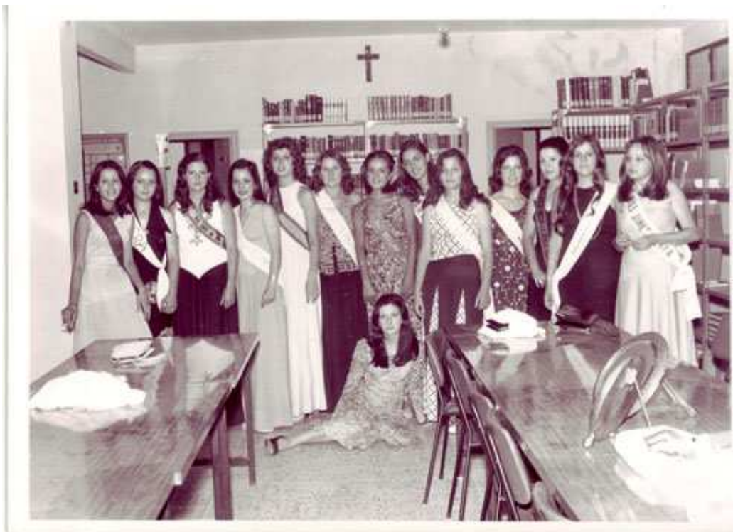
1974. Participantes en la Serranilla.

La elección de Serranilla se celebró en la Calesera el 29 de Agosto y en este año las administraciones empiezan a apostar por este concurso y al ayuntamiento de Huelma, se suma en la organización el Ministerio Información y Turismo y la Diputación Provincial de Jaén.