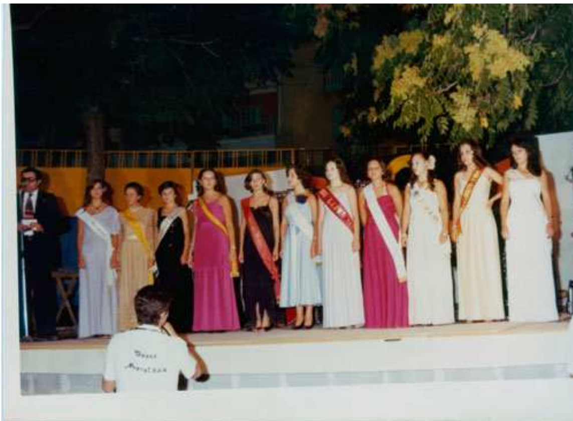
IX Certamen Serranilla de Mágina 1978.

La Serranilla se celebró el martes 29 de agosto a las 11.30 en la caseta municipal instalada en la Calesera.