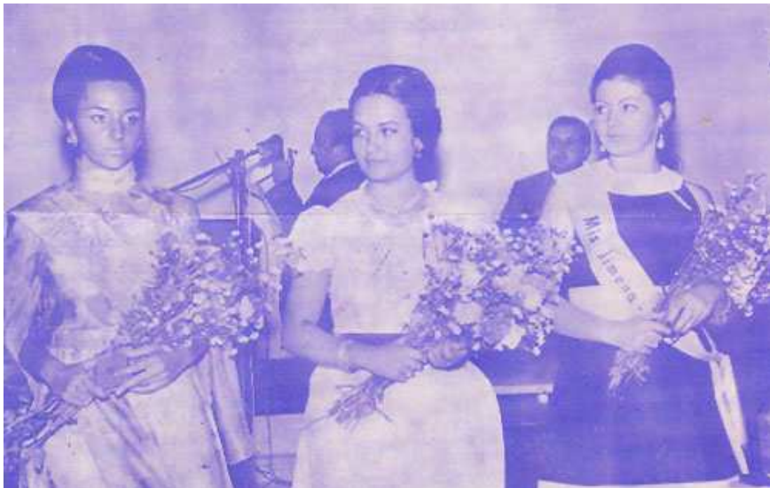
I Edición Serranilla de Mágina, representante de Bedmar. Damas Huelma y Jimena.