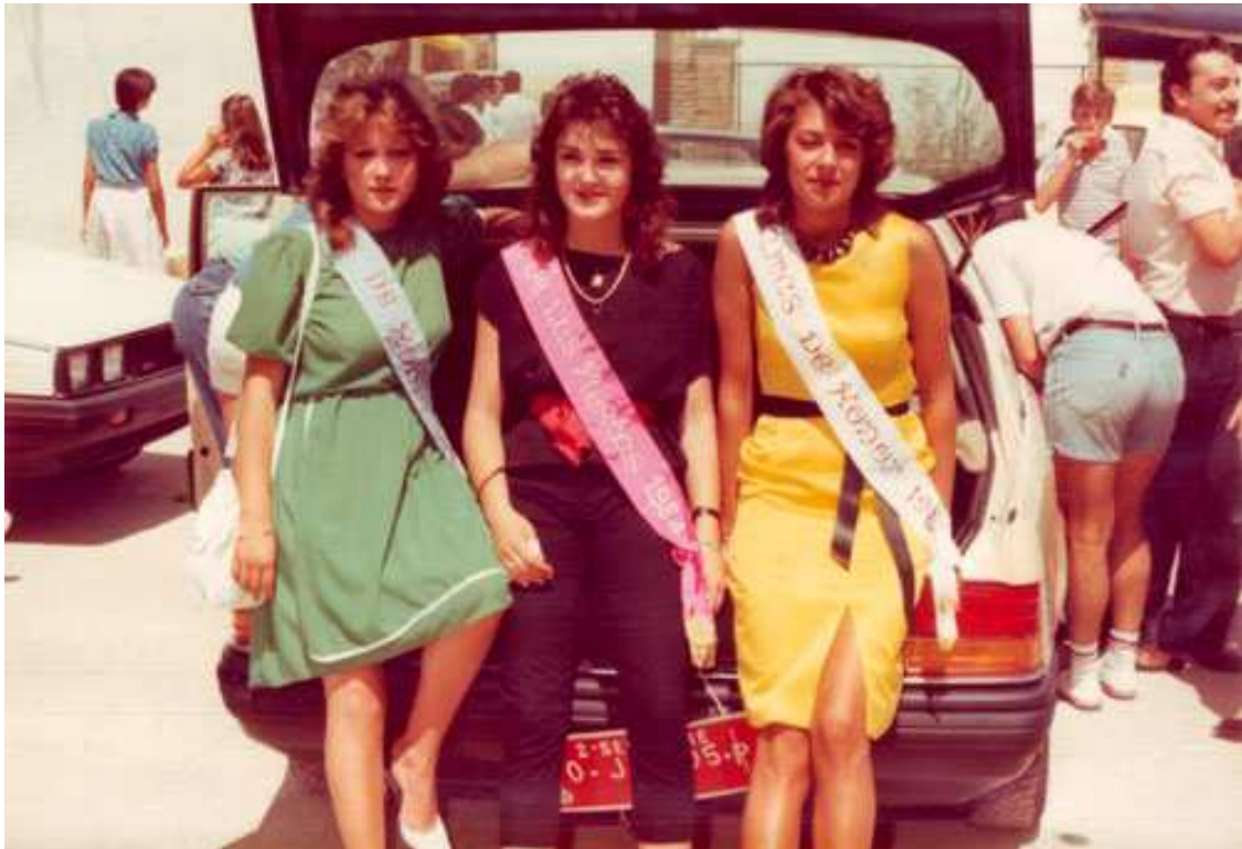
Miss Huelma con sus damas.