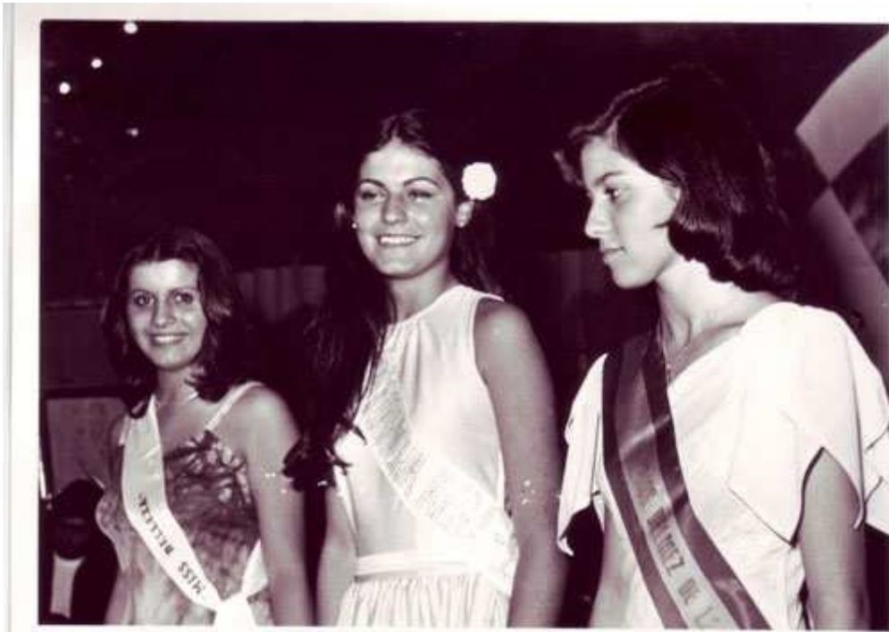
1975. Serranilla Miss Mancha Real con sus damas Miss Belmez de la Moraleda y miss Albánchez.