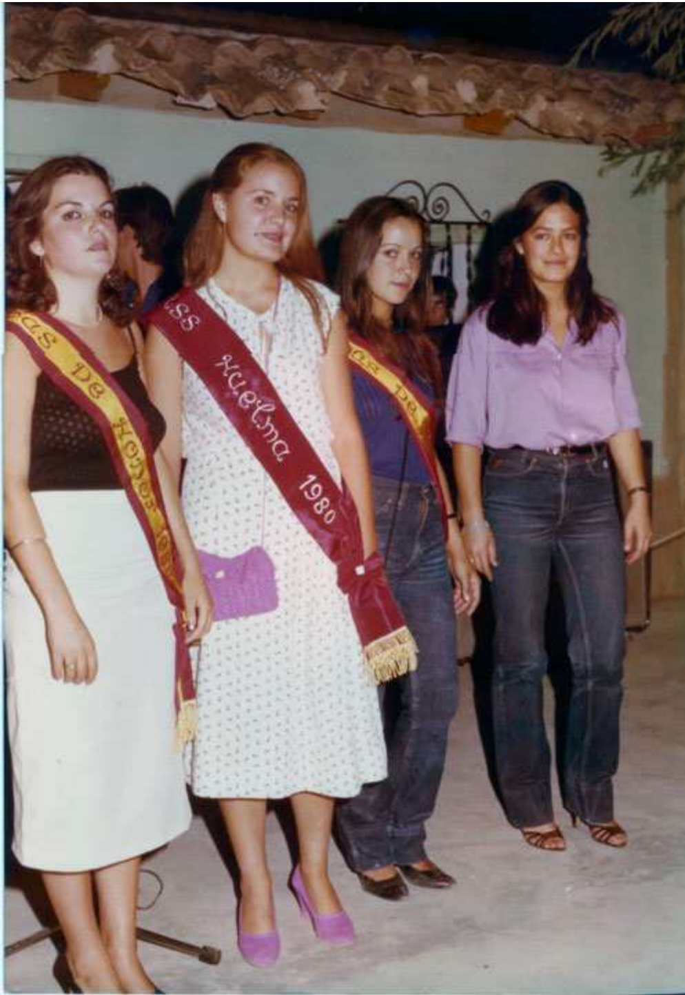
1980. Miss Huelma con sus damas y la miss de 1979.

Las novedades este año fueron dos: el adelanto de la feria en cinco días; se celebró entre el 22 y el 25 de agosto, con el fin de que los paisanos que estaban en Huelma de vacaciones pudieran disfrutar de la feria antes de marcharse, y la celebración de un desfile de modelos de las firmas Vestilux y Fermes SL.