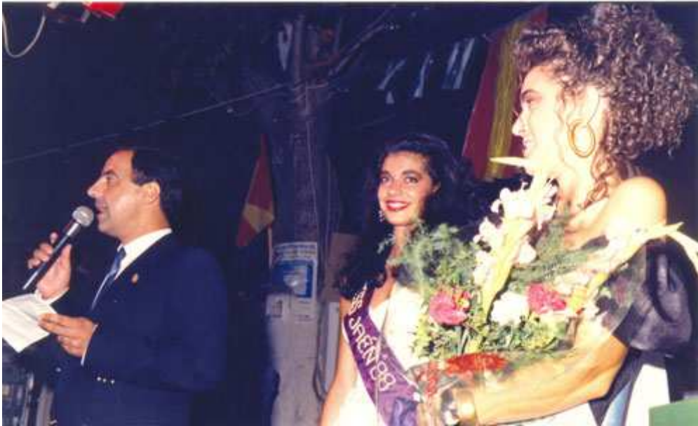
Miss Jaén 1988 en la elección de Serranilla de Mágina.