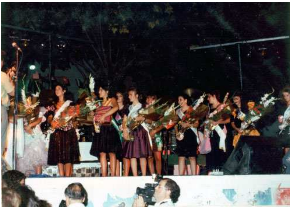
XXI Certamen Serranilla de Mágina. Año 1990.

La actuación estelar corrió a cargo de Los Morancos.