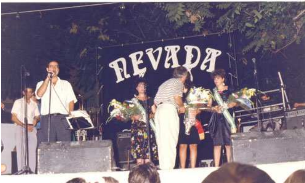
Miss Huelma 1988 junto con sus damas recibiendo las bandas.