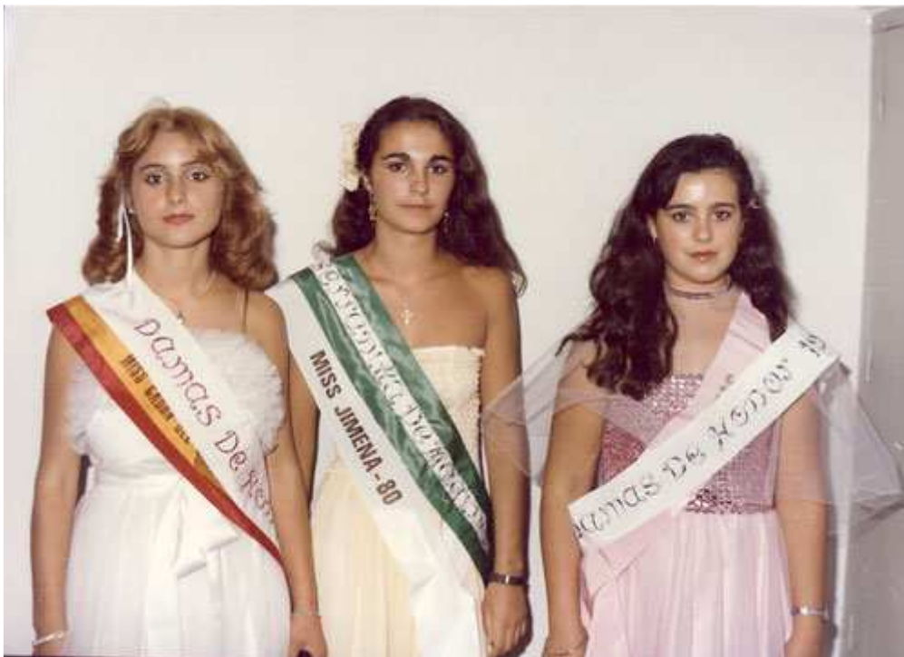
Serranilla de Mágina de 1981 con sus damas de honor.

La elección de la Serranilla fue el día 23 de agosto a las 11.30 y previamente se celebró un desfile de modelos de las mismas marcas que el año anterior. La ganadora fue miss Jimena y las damas Arbuniel y Cabra del Santo Cristo.