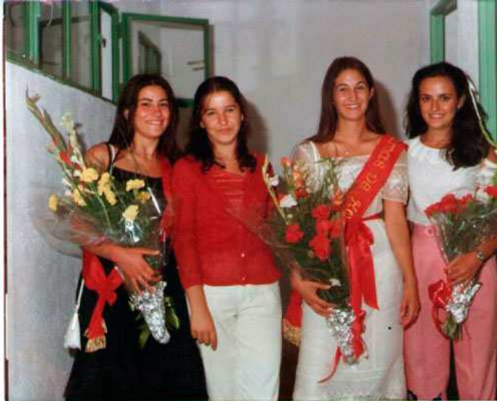
1981. La primera y tercera son las damas de honor de 1981 en el día de su elección.

La elección de la Serranilla fue el día 23 de agosto a las 11.30 y previamente se celebró un desfile de modelos de las mismas marcas que el año anterior. La ganadora fue miss Jimena y las damas Arbuniel y Cabra del Santo Cristo.