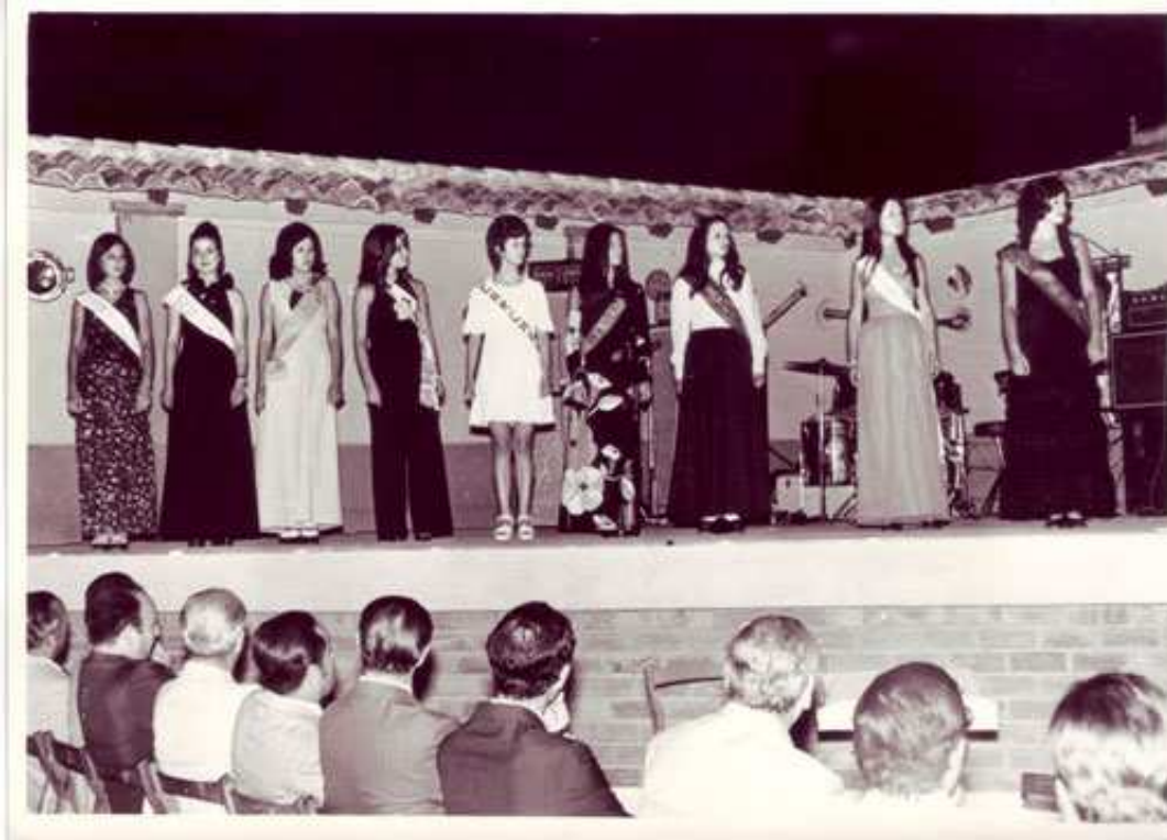
1973. IV Certamen Serranilla de Mágina.