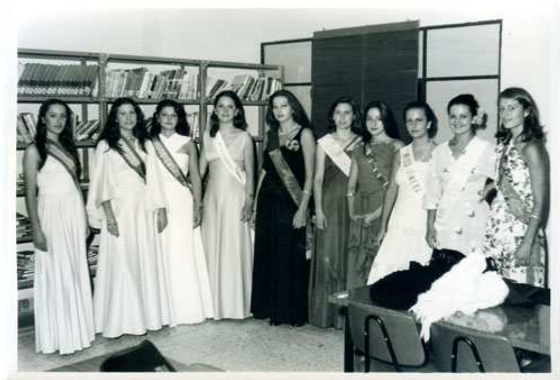
VII Certamen Serranilla de Mágina 1976.

La Serranilla se celebró a las 11'30 de la noche en la caseta municipal de la Calesera el sábado 28 de agosto.