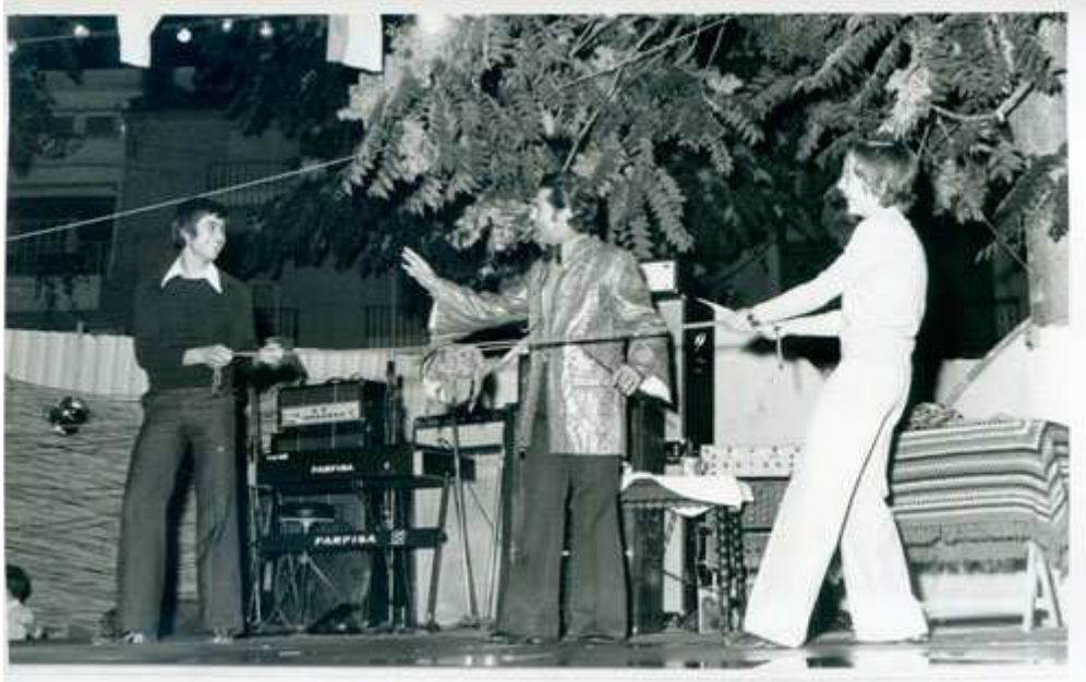
1976. El Bombero mágico durante su actuación en la Serranilla 1976.