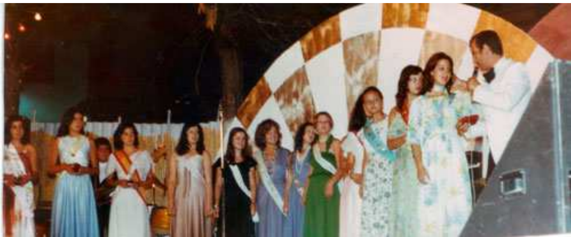
Otra foto de la elección de la Serranilla 1975.

La ganadora fue Miss Mancha Real y sus damas Belmez y Albánchez