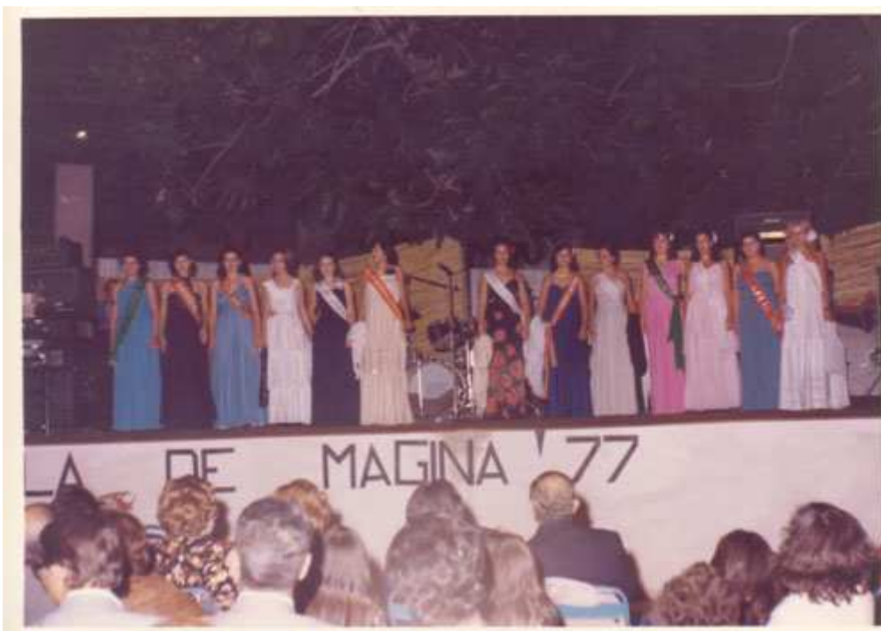
VIII Certamen Serranilla de Mágina 1977.

Las ganadoras fueron miss Pegalajar, Marycano Jiménez, Torres y Huelma