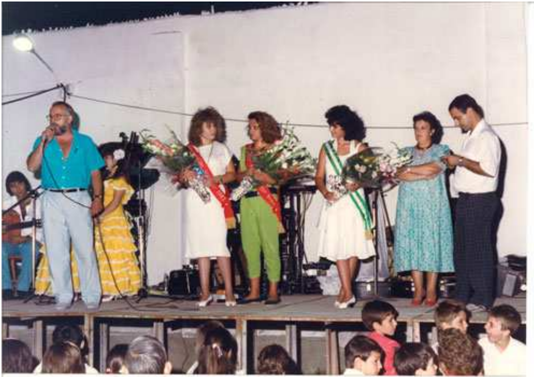
Miss Huelma 1987 con sus damas.