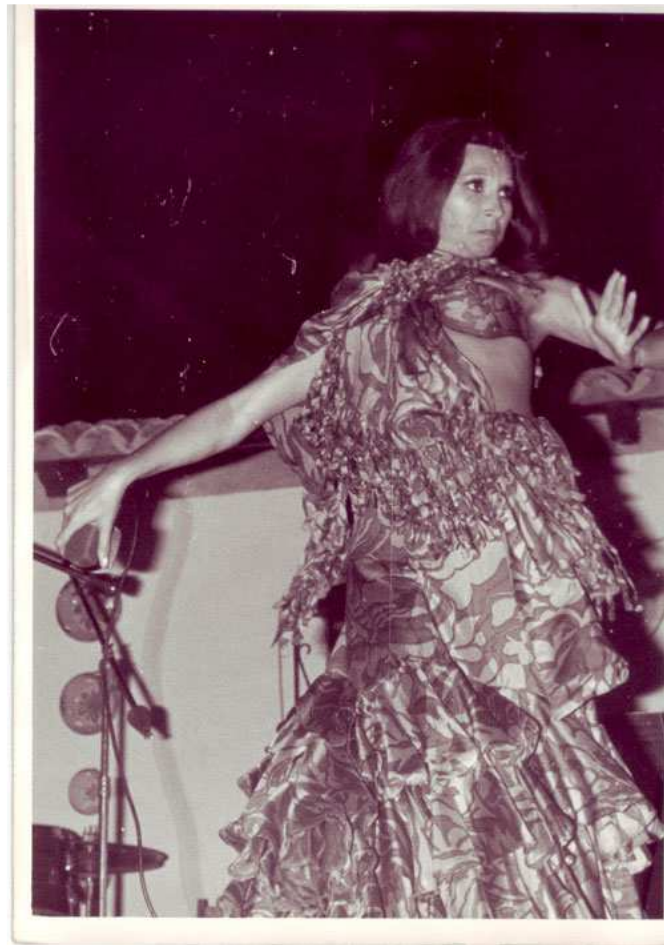
Aunque con un gesto extraño es Rocío Jurado durante su actuación en Huelma.

Finalizó con la actuación de Rocío Jurado.