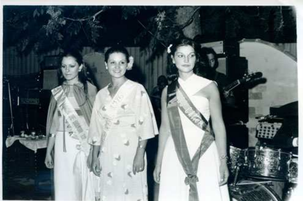
1976. Serranilla Miss Mancha Real con sus damas Miss Larva y Cambil.