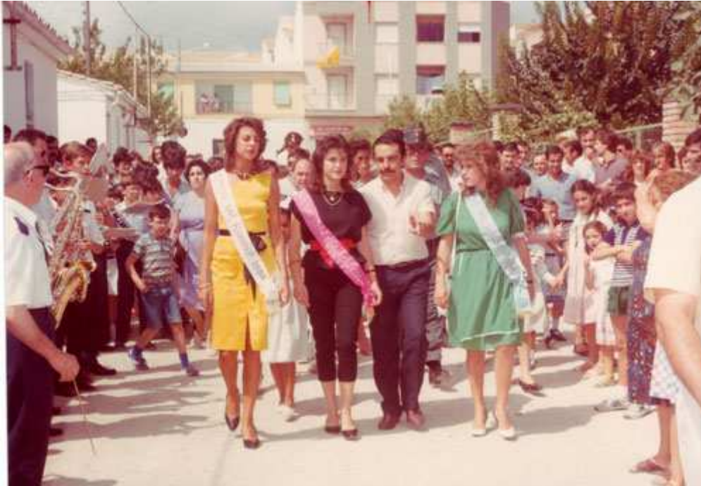
Miss Huelma 1984 con sus damas y el alcalde inaugurando Expohuelma.

El acto de elección de Serranilla se celebró en la caseta municipal instalada en la piscina y acudieron sólo tres pueblos, por lo que tampoco este año hubo serranilla.