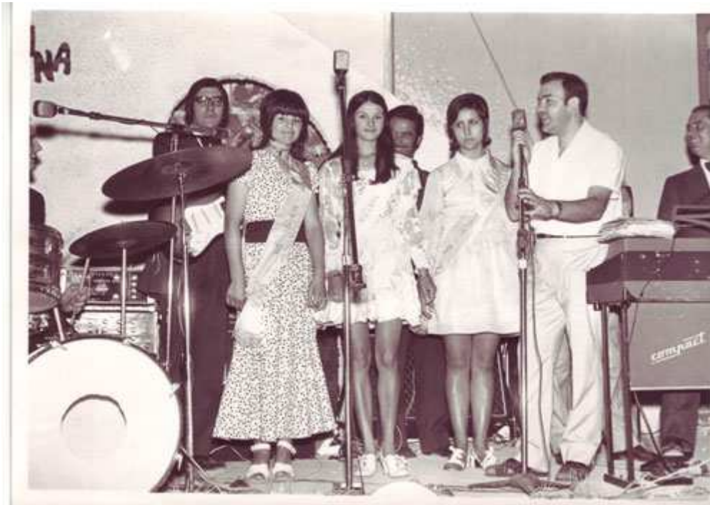
Miss Huelma 1971 con sus damas.

Este año, la caseta municipal se traslada a la piscina y el lunes 30 de agosto a las 11 de la noche se eligió a la serranilla.