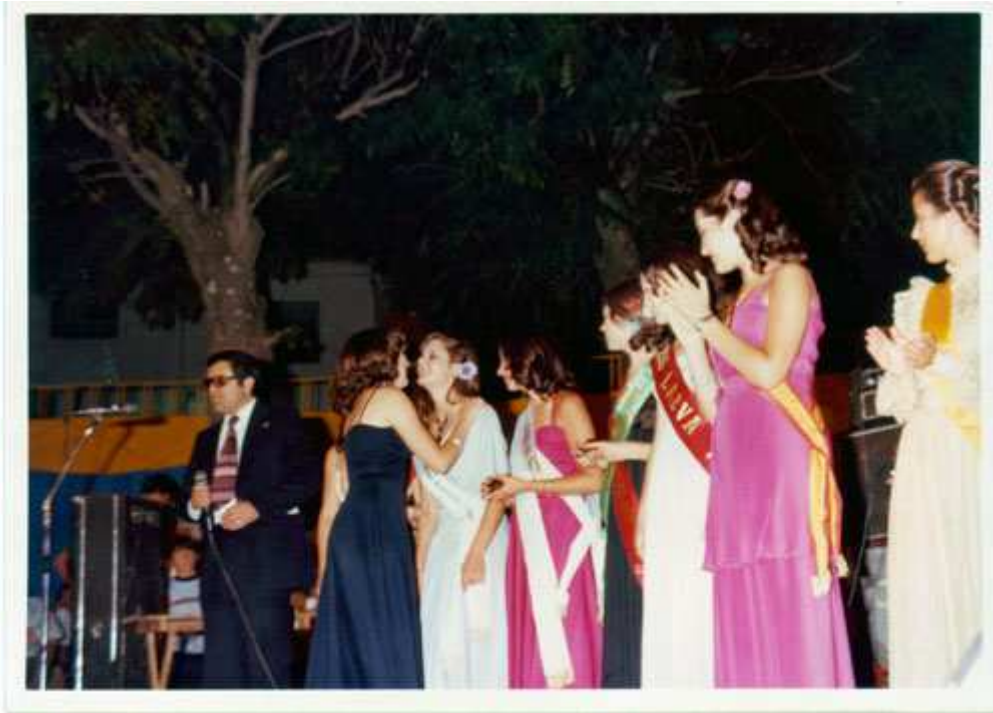
1978. Serranilla y sus damas.

La ganadora fue Mancha Real y las damas Huelma y la otra es la joven de la flor en el pelo y el vestido claro que aparece en la foto de abajo, pero desconozco al pueblo que representaba.