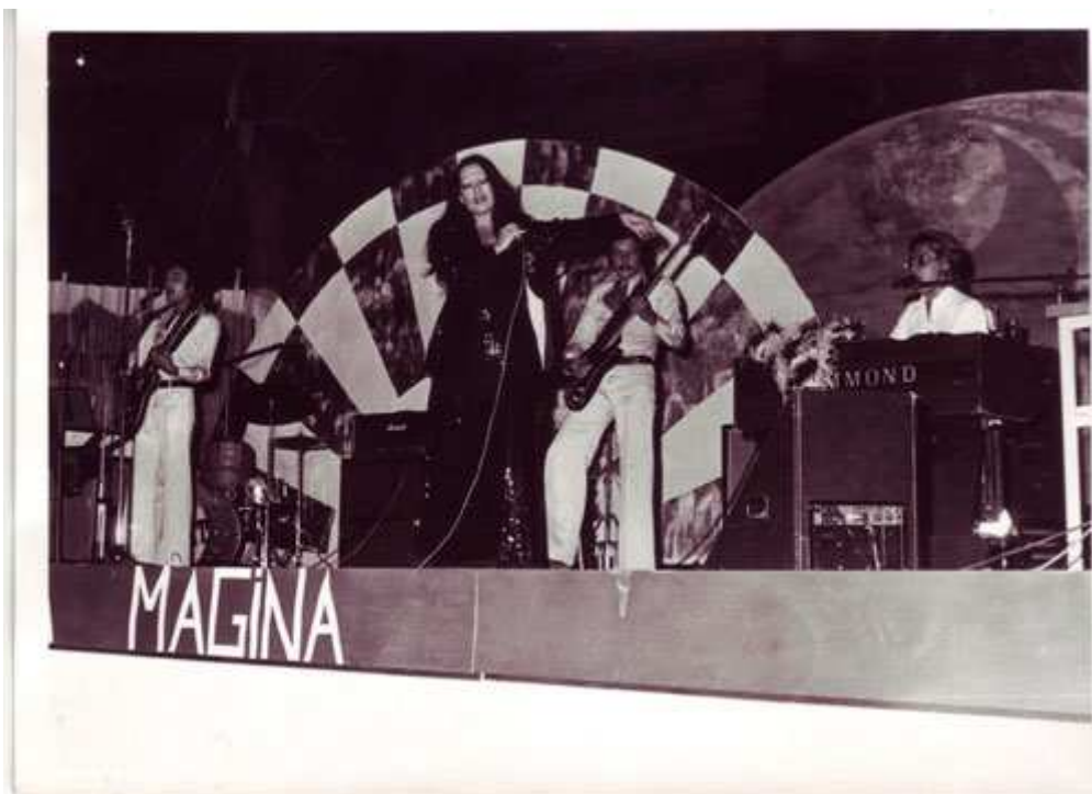
1975. Actuación de Massiel en Huelma.