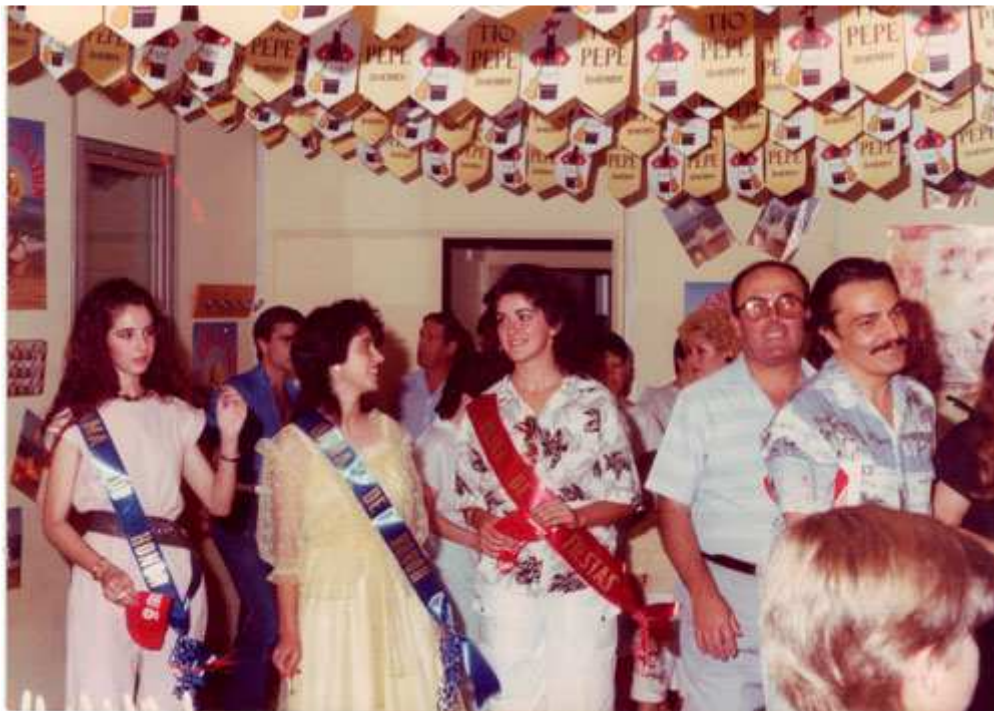
1985 mises de Huelma en expohuelma.

La Serranilla de Mágina se celebró el sábado 24 de agosto en la caseta municipal instalada en la piscina.