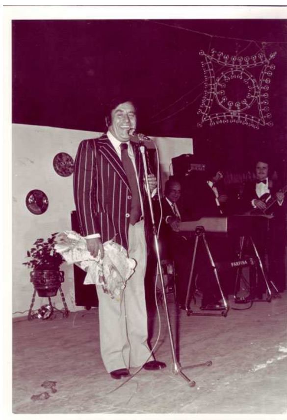
El humorista Cassen durante su actuación en la Serranilla.