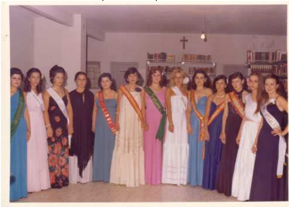
1977 participantes en el concurso de Serranilla de Mágina.

La elección de serranilla se celebró el domingo 28 de agosto en la caseta que ese año estaba instalada en la piscina municipal