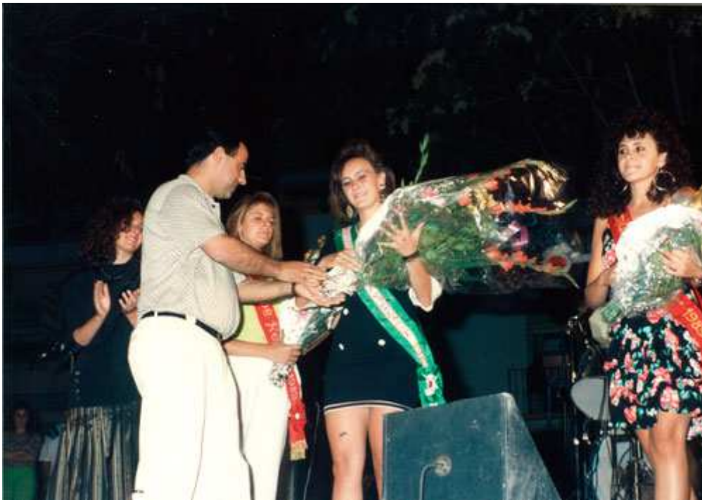
Elección de miss Huelma y damas de honor 1989.

La elección de la Serranilla se celebró a las 12 de la noche del 26 de agosto en la caseta Municipal instalada en la Calesera y en ella estuvo presente miss Jaén 1988, acudieron diecinueve pueblos.