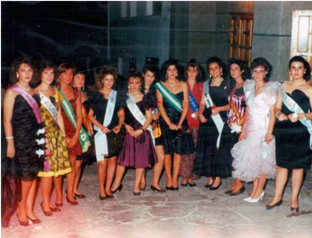
XXI Certamen Serranilla de Mágina. Participantes.