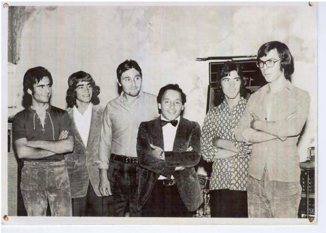
1971. Los Jónicos con Torrebruno en Huelva.