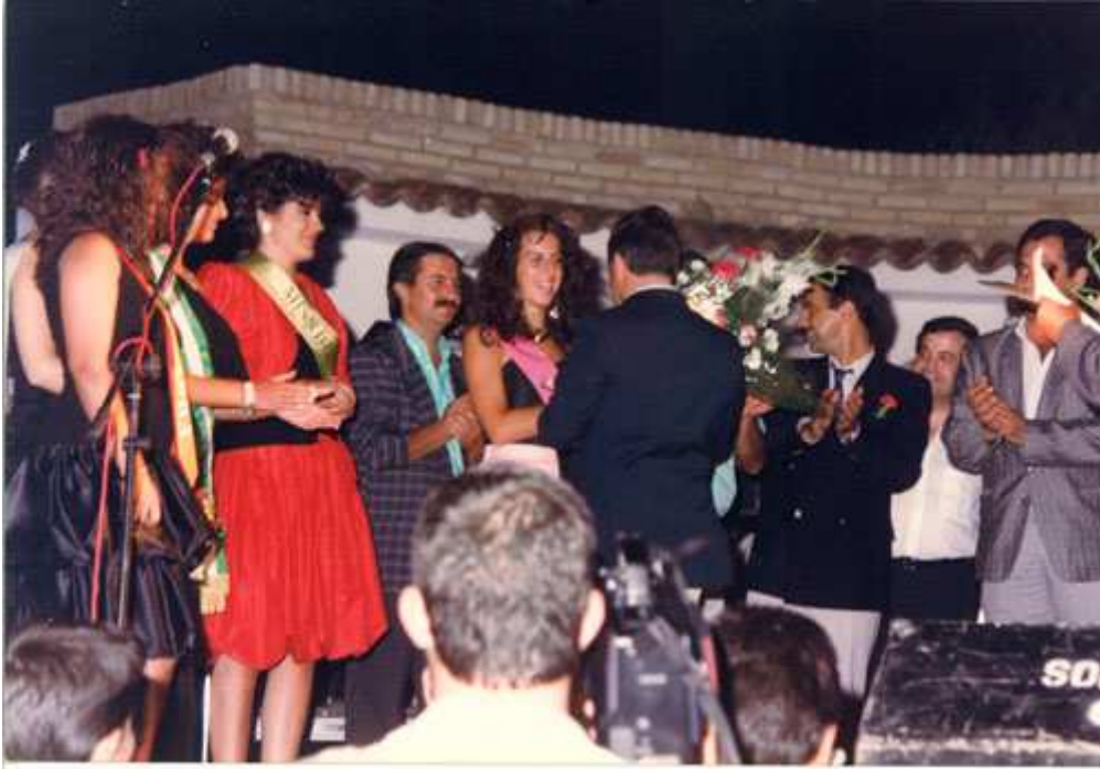
XVIII Certamen Serranilla de Mágina 1987 en la piscina municipal.

La actuación estelar corrió a cargo de Luz Casal.