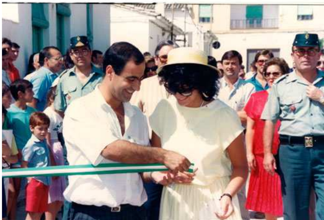
Miss Huelma 1987. Inaugurando Expohuelma.

En este año la Serranilla de Mágina se celebró el sábado 22 de agosto y al haberse celebrado elecciones municipales, hubo cambio de consistorio y la Serranilla de Mágina volvió a tomar impulso. Además, pasó a denominarse Certamen Serranilla de Mágina.