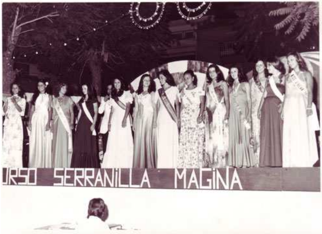
1975. VI Certamen de la Serranilla de Mágina.