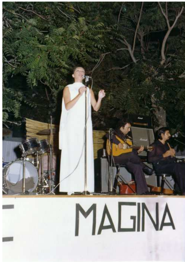
Betti Misiego durante su actuación en Serranilla 1977.