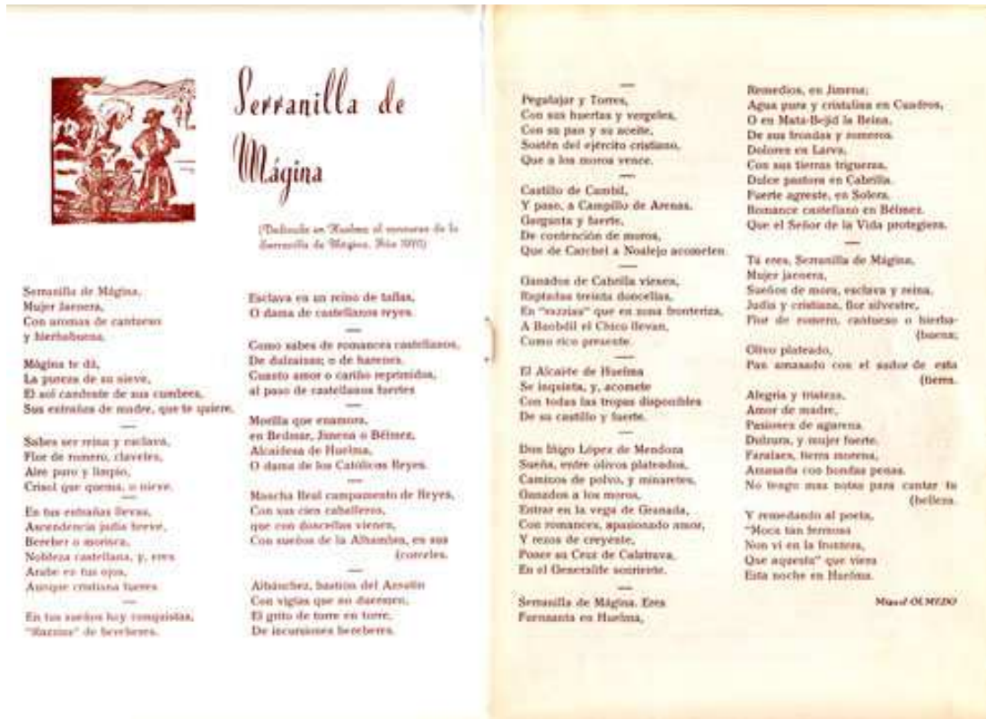
Primer pregón de la Serranilla.

Continuó con un desfile de las participantes y la consiguiente deliberación del jurado integrado por los alcaldes concurrentes.