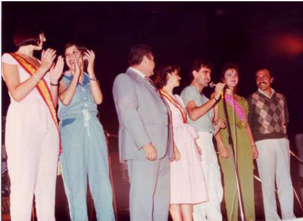
Las tres representantes que acudieron a la Serranilla 1984 con sus respectivos alcaldes.

El acto de elección de Serranilla se celebró en la caseta municipal instalada en la piscina y acudieron sólo tres pueblos, por lo que tampoco este año hubo serranilla.