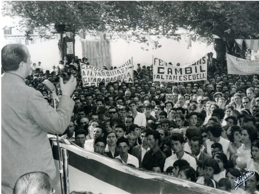
Vecinos de Cambil en la concentración