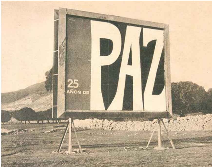
Valla publicitaria con propaganda de la campaña “25 años de paz”.

Esta doble visión se plasmará bien en esta campaña publicitaria que inundará de carteles y folletos toda la geografía de España. Por una parte, se incide en el término conciliador de “paz” en vez de insistir como hasta ese momento en el de “victoria”, pretendiendo de esta manera dejar en el olvido el inmenso dolor que supuso la cercana guerra y mostrar a cambio la nueva España que va surgiendo. Por otra serán los artífices y ganadores de aquel enfrentamiento los que intervendrán de manera muy activa en los actos que se organizaron.