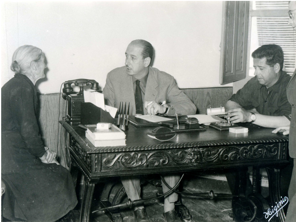
El Gobernador Civil atendiendo a una anciana

Todavía tuvo tiempo el Gobernador aquella mañana para inaugurar, como no, varias infraestructuras, destacando la red de abastecimientos de agua a los domicilios de Huelma, servicio que supone un salto muy cualitativo en el bienestar de la ciudadanía y por lo tanto muy apreciado.