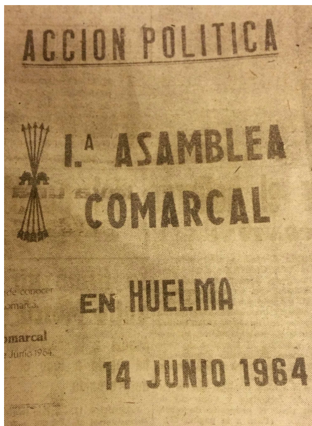
Cartel anunciador de la Asamblea

Conocemos ya el porqué de la visita; conozcamos ahora de manera detallada los hechos que ahora entenderemos mejor. Fue el 14 de junio de 1964 cuando a las 10.30 de la mañana se dan cita en el Ayuntamiento de Huelma los “camisas azules” en un marco creado para la ocasión, y que dudo que se volviera a repetir: “I Asamblea Comarcal de la Falange en Huelma”.