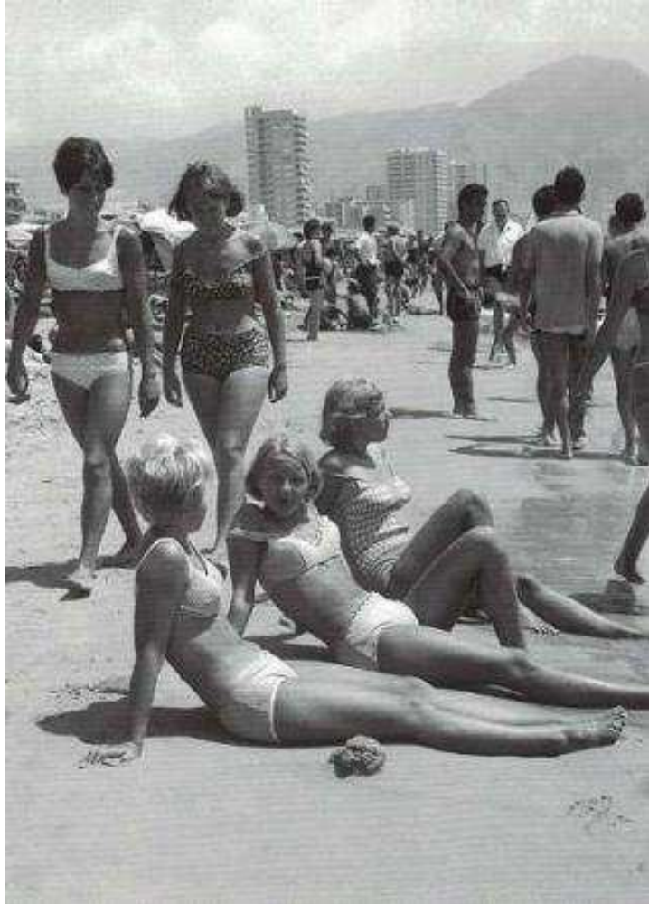
Turistas extranjeras en Benidorm