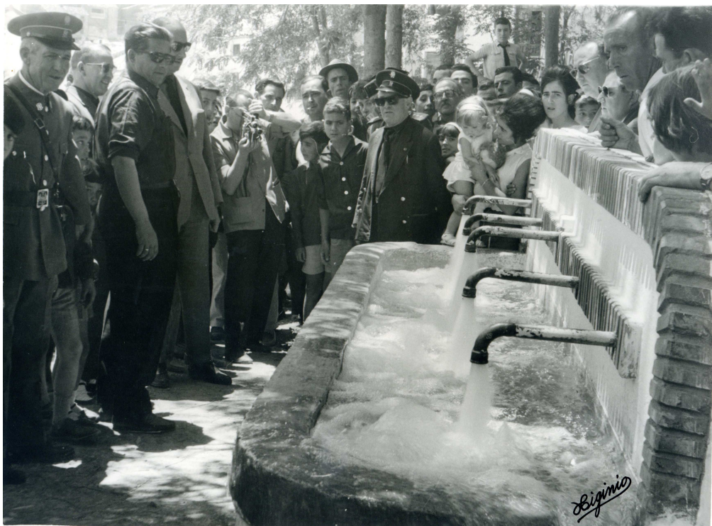
La inauguración de la red pública de agua se simbolizó con su llevada a la fuente de Los Cinco Caños que había en la Plaza de la Calesera

Todavía tuvo tiempo el Gobernador aquella mañana para inaugurar, como no, varias infraestructuras, destacando la red de abastecimientos de agua a los domicilios de Huelma, servicio que supone un salto muy cualitativo en el bienestar de la ciudadanía y por lo tanto muy apreciado.