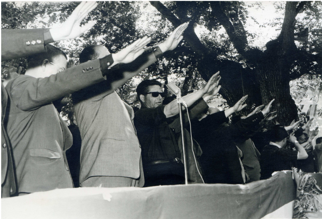
Cantando “Cara al Sol”