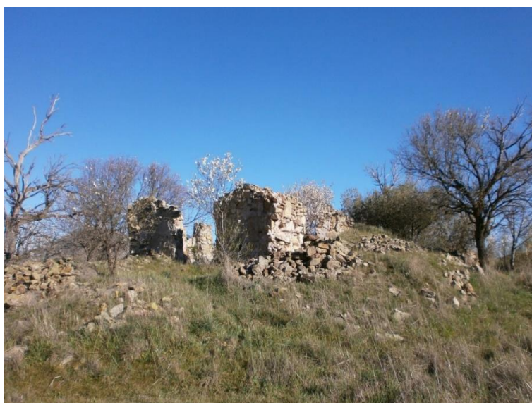
Ilustración 10. Ermita de las Cabritas. Actualidad.

Los servicios en ella se ofrecían los domingos, pero con el aumento de la afluencia de gente, se vieron en la necesidad de ampliarla, algo que no llegó a suceder ya que el eremita desapareció de la nada. Con el tiempo y la dejadez del lugar se pierde toda la construcción, además de que hoy en día ya no cuenta con ningún camino de acceso, por lo que hay que atravesar el campo para llegar hasta ella. La colina en la que se hallaba es conocida hoy en día como cerro de la ermita.