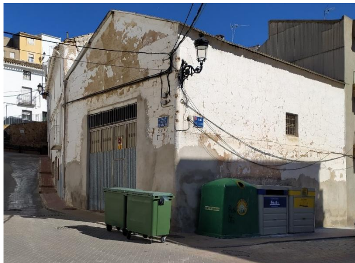
Ilustración 7. Ermita de Santa Ana. Actualidad.