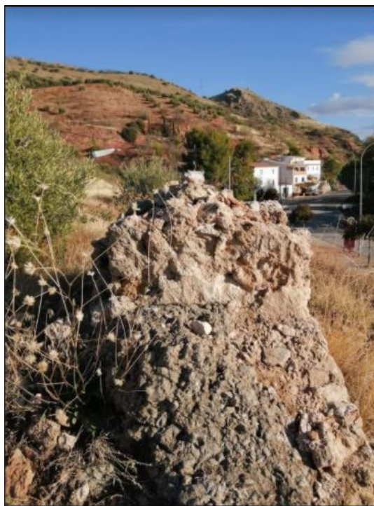
Ilustración 9. Ermitica. Actualidad.

La edificación era una estructura de adobe de base cuadrangular y poco más de un metro cuadrado, con una altura de 1,50 metros, por lo que en muchos casos más que como una ermita se podía considerar como una pequeña hornacina. En la parte superior encontrábamos una ventanita protegida por un cristal, y en la parte inferior tres peldaños a modo de escalera para poder asomarse a la ventana. En el interior de esta se hallaba una estampa litográfica de la Virgen de la Fuensanta, y junto a esta una pequeña imagen de Santa Ana, la madre de la Virgen María.