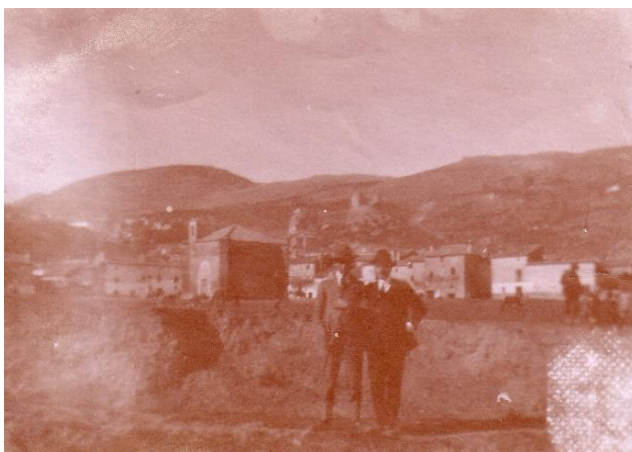
Ilustración 8. Ermita de San Marcos.

En 1845 se menciona en diferentes documentos debido al cierre al culto, ya que presentaba un mal estado de conservación, sin embargo se consiguen obtener fondos para la restauración y reapertura del edificio. Esta no será la única vez que se encuentre amenazada de cierre ya que por la falta de inversión estuvo a punto de desaparecer en el año 1907. En este caso no se cerró ya que se vendió la conocida Ermita de Santa Ana para hacer frente a la restauración de las ermitas de San Marcos y San Sebastián. El cierre definitivo llegó en el año 1940 debido a su deterioro por lo cual fue demolida y sus restos fueron utilizados para la construcción de las viviendas de alrededor.