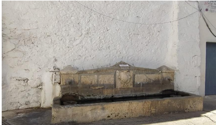
Ilustración 6. Fuente del Santo. Pies de la Ermita de San Sebastián. Actualidad

En definitiva, esta ermita es considerada un inmueble protegido con un estado de conservación alarmante, ya que tras su venta a un particular a fines del siglo XX se ha convertido en un almacén de chatarra. Aunque esta no ha sido su utilidad más curiosa ya que también sirvió durante un tiempo como cárcel tras la Guerra Civil.