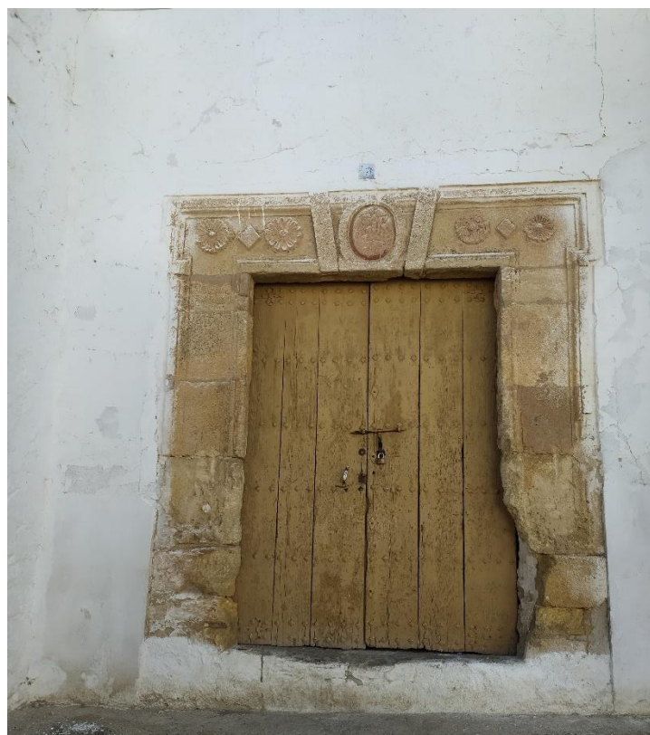
Ilustración 5. Ermita de San Sebastián. Actualidad.

La ermita no solo albergará la figura de San Sebastián, sino que además en ella encontrábamos las imágenes de San Juan, La Dolorosa, La Verónica e incluso la imagen del Santo Sepulcro. Estas figuras salían durante la Semana Santa, pero se perdieron durante la Guerra Civil, sin embargo tras acabar esta se donó a la ermita una