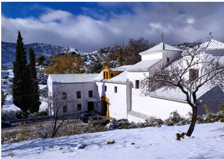
Ilustración 1. Ermita de la Virgen de la Fuensanta. Exterior

La leyenda cuenta, que la Virgen se apareció a la hija del alcaide musulmán de Cambil, a quien su padre había cortado las manos por haber ayudado a los cristianos. Huyendo del castigo se sentó al lado de un manantial donde la Virgen le pidió que metiera los brazos en la fuente con lo que recobró sus manos. Un pastor que había presenciado el hecho se llevó la talla de la virgen hacia Huelma, sin embargo al día siguiente desapareció. Al volver al manantial, la imagen se encontraba en el mismo sitio, por lo que se decidió construirle allí un santuario. Este hecho milagroso es a través del cual comienza la devoción hacia esta Virgen.