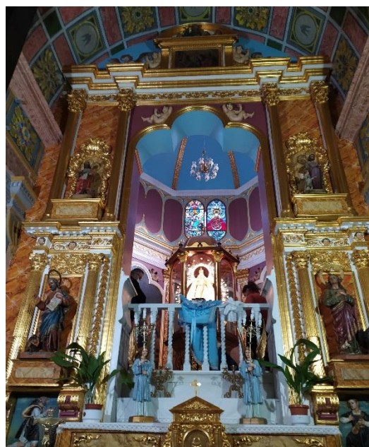
Ilustración 2. Retablo de la Ermita de la Virgen de la Fuensanta

Hoy en día encontramos un retablo relativamente nuevo, ya que el anterior se perdió, sin embargo contamos con un cuadro que nos muestra como era este retablo. El cuadro se guarda en la sacristía de la iglesia de la Inmaculada Concepción de Huelma, este data de 1868. En el centro del altar encontramos una apertura que da paso al camarín, enmarcado por el retablo. En el antiguo retablo aparecían las figuras en los laterales de San Pedro y San Pablo, entre columnas pareadas. Bajo estas figuras se representaba a dos pastores que hacían referencia al milagro de la aparición. Sobre los santos apreciábamos las figuras de Santa Bárbara y Santa Catalina de Alejandría. En el centro del retablo, en la parte superior, aparecía representada la imagen de la coronación de la Virgen de la Trinidad, y justo bajo él la imagen del Santo Rostro.