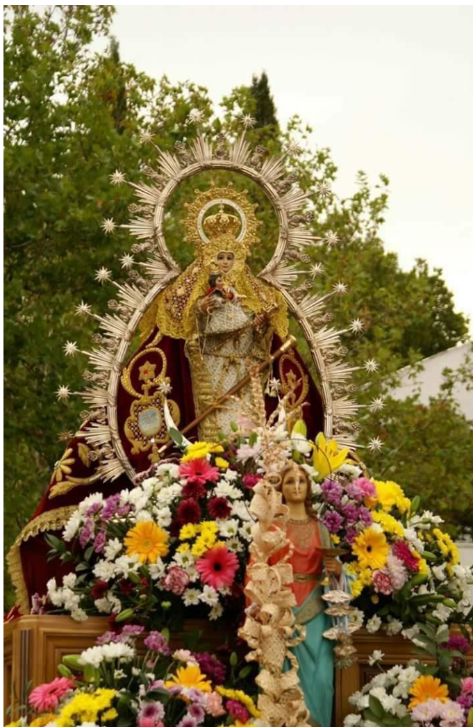
Ilustración 3. Virgen de la Fuensanta junto a Santa Ana. Primer domingo de mayo.