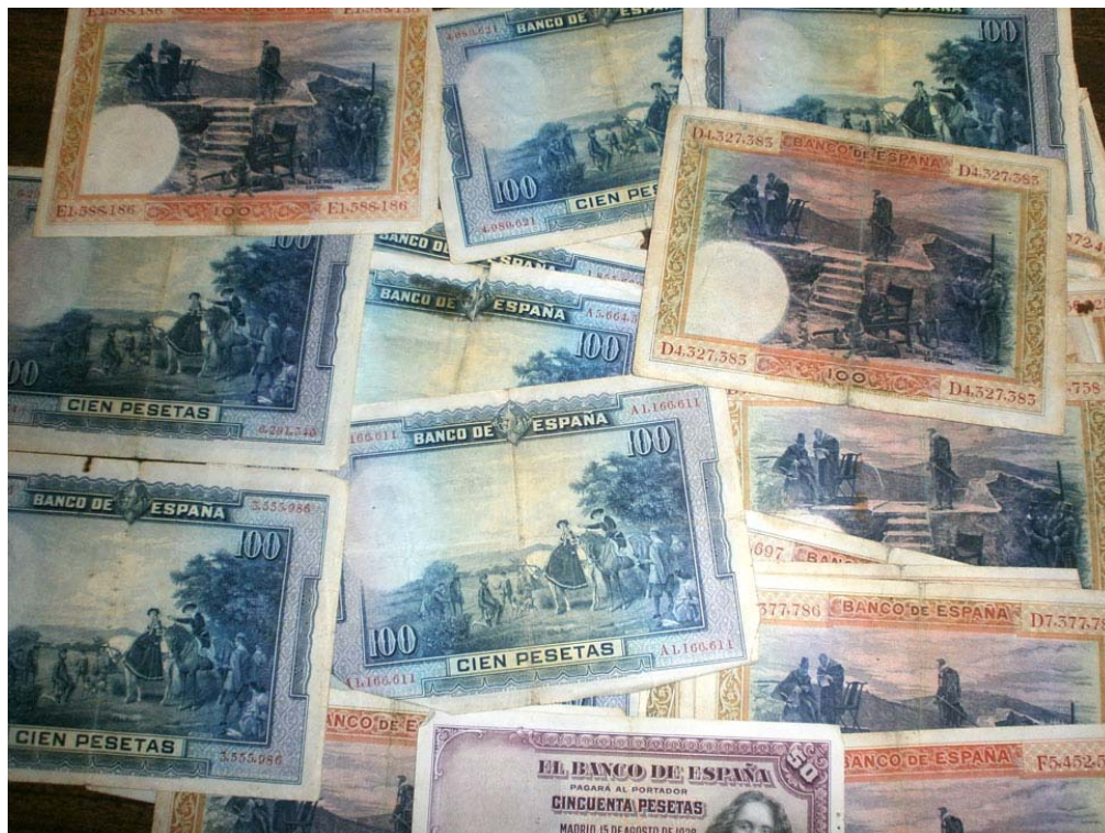
Tesoro encontrado en Huelma