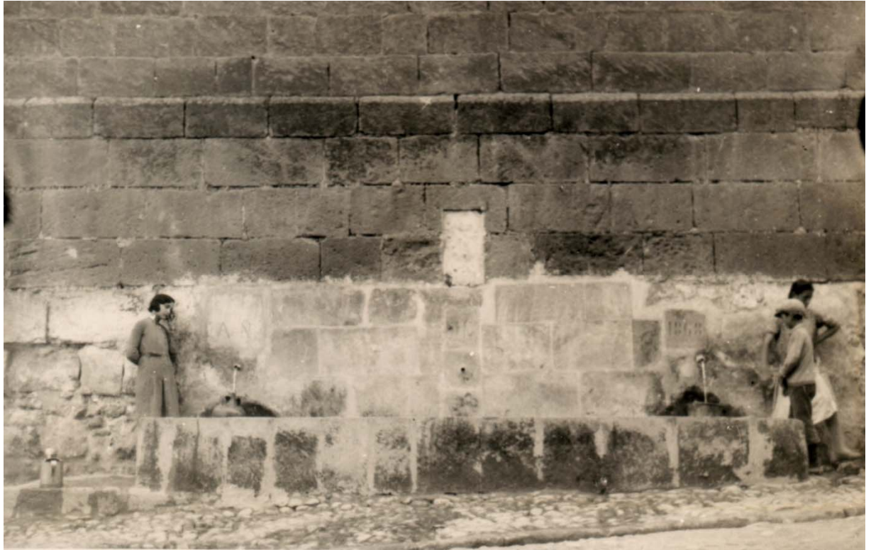
Fuente del Convento. Por encima del caño izquierdo podemos leer “Año”. Encima del caño derecho “1868” 4