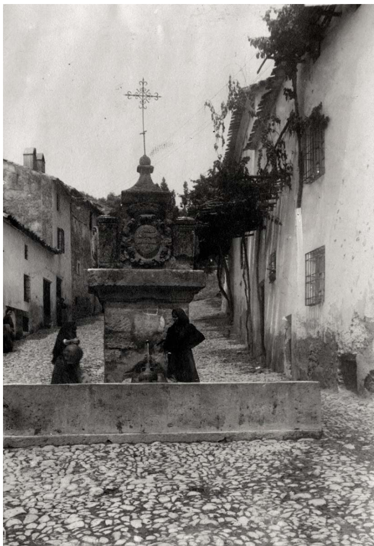
Fuente Seca. Sobre el caño, labrado en la piedra que clarea sobre las demás, se puede leer, una vez ampliada, “Año de 1868” 5