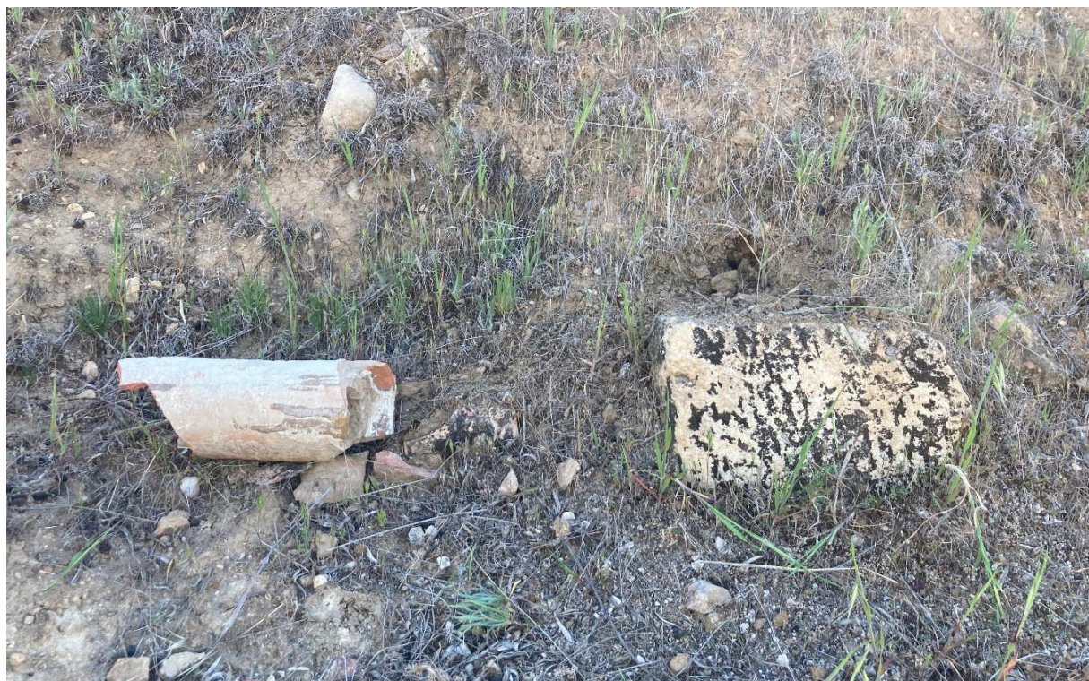
Antigua cañería de cerámica

Pero aún no ha terminado este Día de la Virgen de Agosto de 1868. Al final de la mañana, y aprovechando que están juntos cabildo y mayores contribuyentes, se convoca un pleno extraordinario en el que se hace constar la falta de fondos para poder llevar el agua hasta otras dos fuentes de la localidad según el proyecto inicial. Todos los asistentes acuerdan continuar con las obras, debiéndose obtener el dinero necesario de la misma forma y manera como hasta ahora, es decir, recurriendo al Pósito. Pero hay que tener la pertinente autorización de la capital, y los trámites burocráticos llevan tiempo. Se dispone entonces: