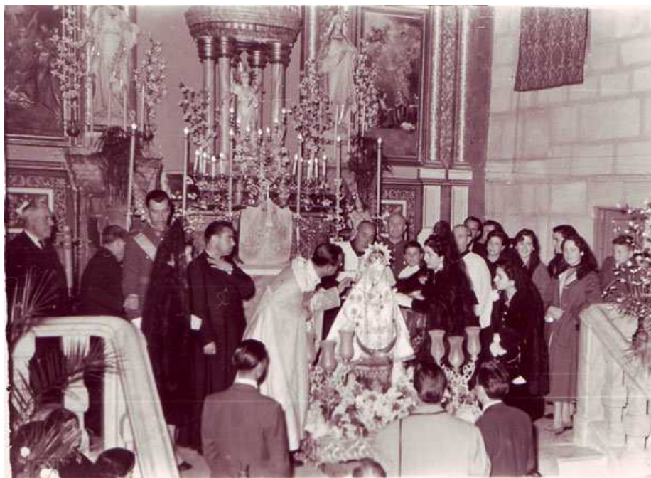
2 junio 1954. Asistentes al acto de "coronación" de la Virgen de la Fuensanta

Desde la segunda mitad del siglo XV, cuando la leyenda atribuye la aparición de la Virgen de la Fuensanta a un pastor de Cambil, nuestra patrona ha gozado de una gran devoción en toda la comarca de Sierra Mágina, que se ha traducido en ofrendas y homenajes, realizados generalmente a nivel personal o familiar.