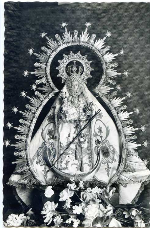
Una de las primeras imágenes de la Virgen de la Fuensanta con bastón de alcaldesa.

La trascripción del acta quedó como sigue: