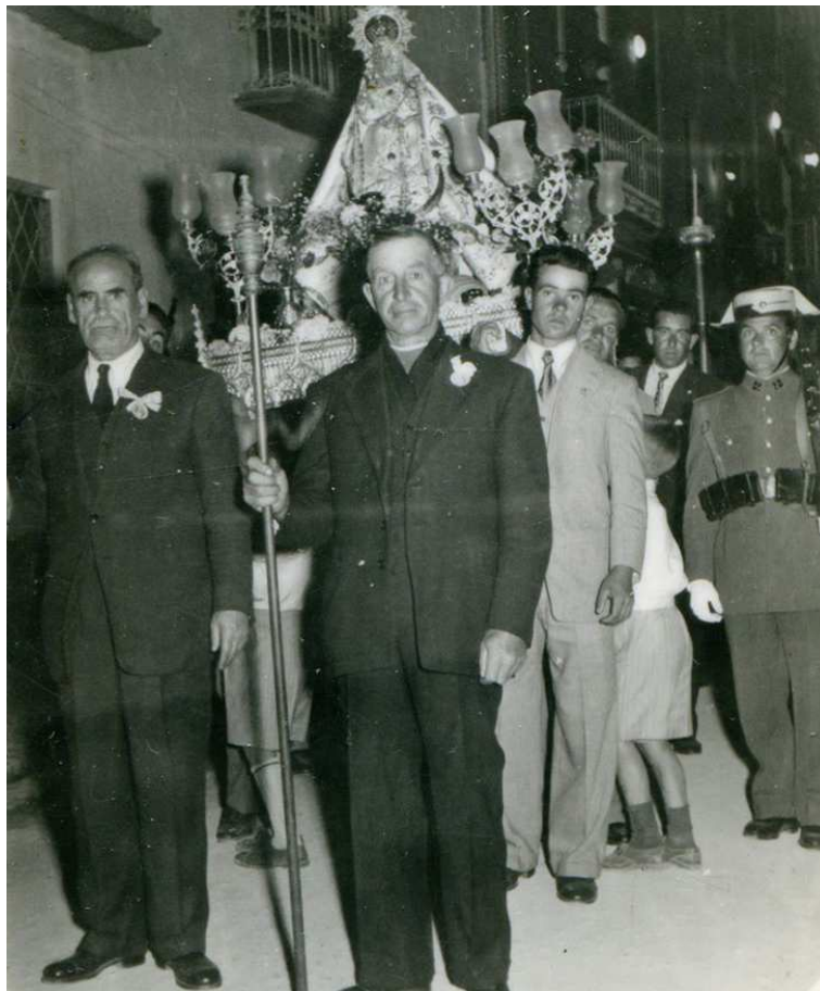
1950. La imagen muestra a la Virgen cuando aún no era alcaldesa de Huelma

El segundo homenaje que tuvo lugar el día 1 de junio de 1960 pasó más desapercibido al vecindario, ya que al celebrarse en el ayuntamiento, no se convocó al pueblo ni se celebró una ceremonia religiosa grandiosa como había ocurrido en la “coronación”, pero no por eso careció de importancia, más bien al contrario, fue un hecho de relevancia en la relación del pueblo y su patrona, la Virgen de la Fuensanta, a la que se nombró nada menos que alcaldesa honoraria de Huelma.