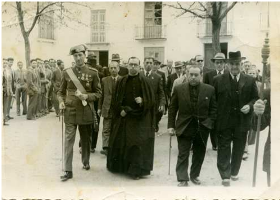
1954 .Autoridades dirigiéndose al acto de “coronación” de la Virgen

Aún así, el pueblo acogió con mucho fervor este proyecto que aunque surgió como iniciativa del ayuntamiento, recogía el sentir popular, como forma de mostrar la fe, el amor, el cariño y el respeto de nuestra villa a su patrona.