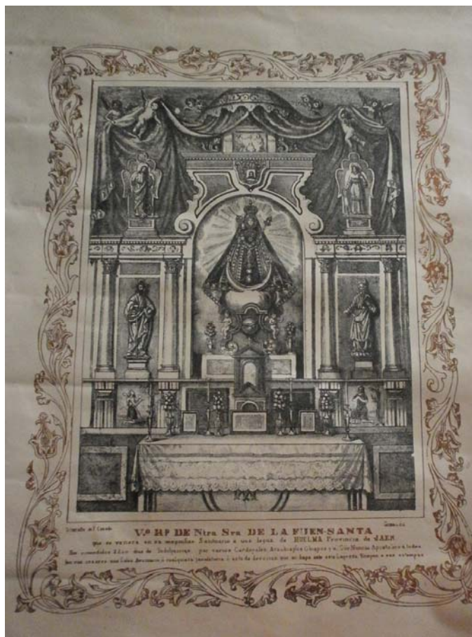
Litografía de la Virgen de la Fuensanta