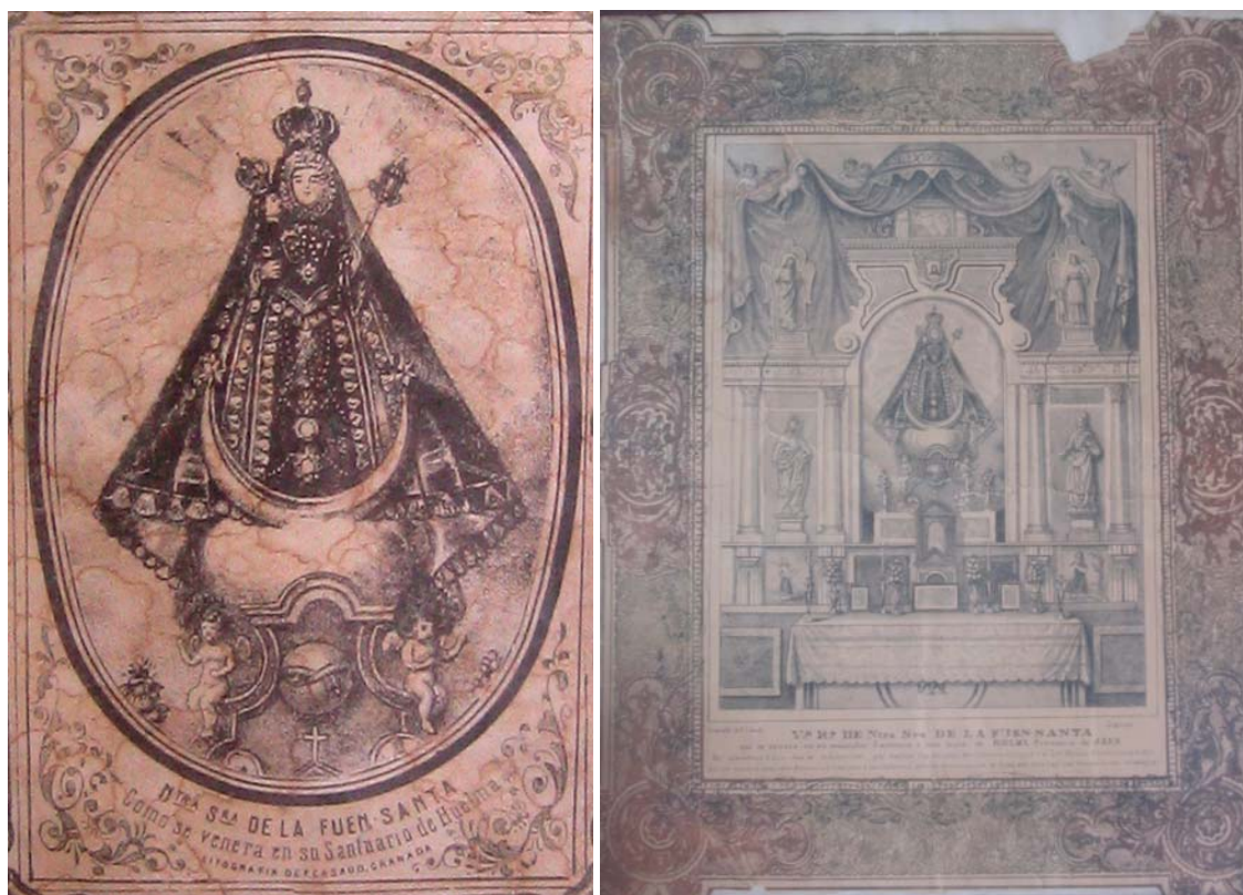
Litografías de la Virgen de la Fuensanta

Al pie de una y otra se puede leer “V a . H o . de Nuestra Señora de la Fuen-Santa que se venera en su magnifico santuario a una legua de HUELMA, provincia de JAÉN. Son concedidos 2200 días de indulgencia por varios Cardenales, Arzobispos, Obispos y al Sr. Nuncio Apostólico a todos los que rezaren una salve, Ave Maria o cualquiera jaculatoria o acto de devoción que se haga ante esta Sagrada Ymagen o sus estampas” Firma la litografía F.Casado (Granada)