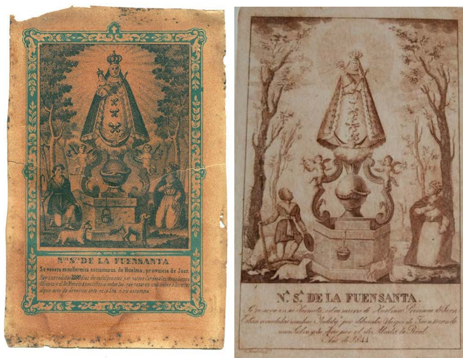
Litografías de la Virgen de la Fuensanta

Hay un tercer modelo, en que se prescinde del retablo y aparece Nuestra Patrona rodeada de un óvalo.